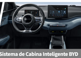
Sistema de Cabina Inteligente BYD