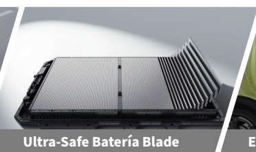
Ultra-Safe Batería Blade