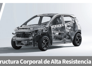
Estructura Corporal de Alta Resistencia

La autonomía (total de kilómetros que puede recorrer un vehículo eléctrico sin hacer paradas para recargar) descrita en la ficha técnica, depende de diferentes factores, incluyendo de manera enunciativa y no limitativa de la capacidad de su batería, el uso que se haga del motor, las características del vehículo, el estilo de conducción, condiciones de manejo, los hábitos de manejo del usuario, las condiciones del camino, así como el peso y tamaño del vehículo, su potencia, el tipo de carretera, el clima, la velocidad, del propio conductor, entre otros.