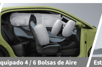
Equipado 4 / 6 Bolsas de Aire