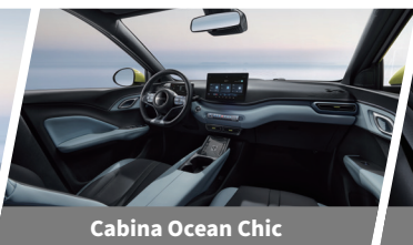
Cabina Ocean Chic