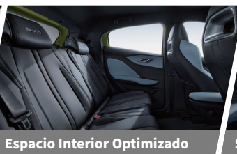
Espacio Interior Optimizado