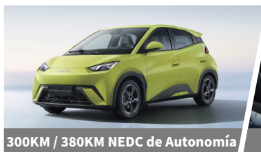
300KM / 380KM NEDC de Autonomía